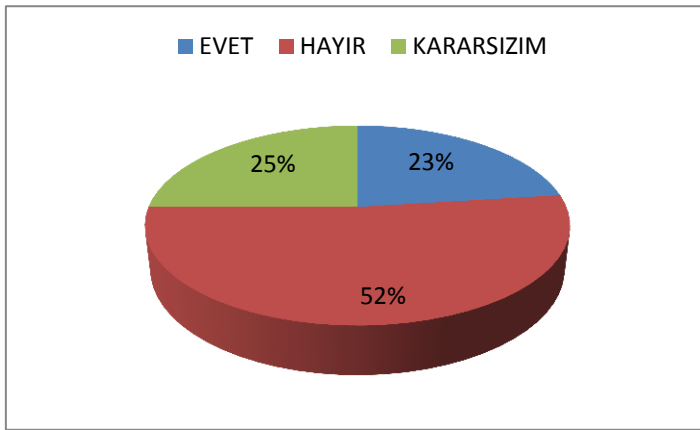
Şekil 2: Katılımcıların İş Ararken İŞKUR'dan Yararlanma Durumu

Şekil 2'de araştırmaya katılan üniversite öğrencilerinin iş ararken İŞKUR'dan yararlanma durumlarına ilişkin dağılımları gösterilmiştir. Katılımcıların %52'si iş ararken İŞKUR'dan yararlanmayacaklarını, %23'ü yararlanacaklarını belirtmişlerdir. Katılımcıların %25'i ise bu konuda kararsız kalmıştır.